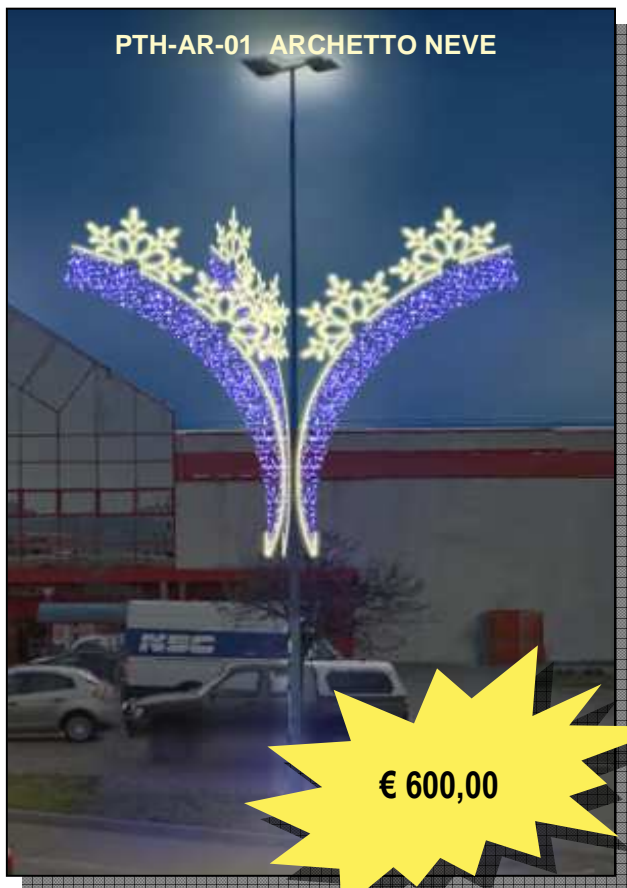
PTH-AR-01 ARCHETTO NEVE