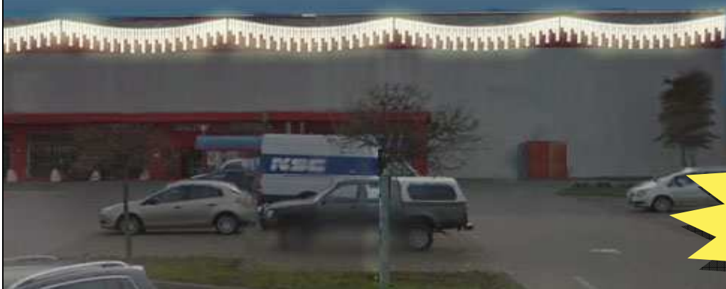
CC05 - FRANGIA H 110 (LED SMD)