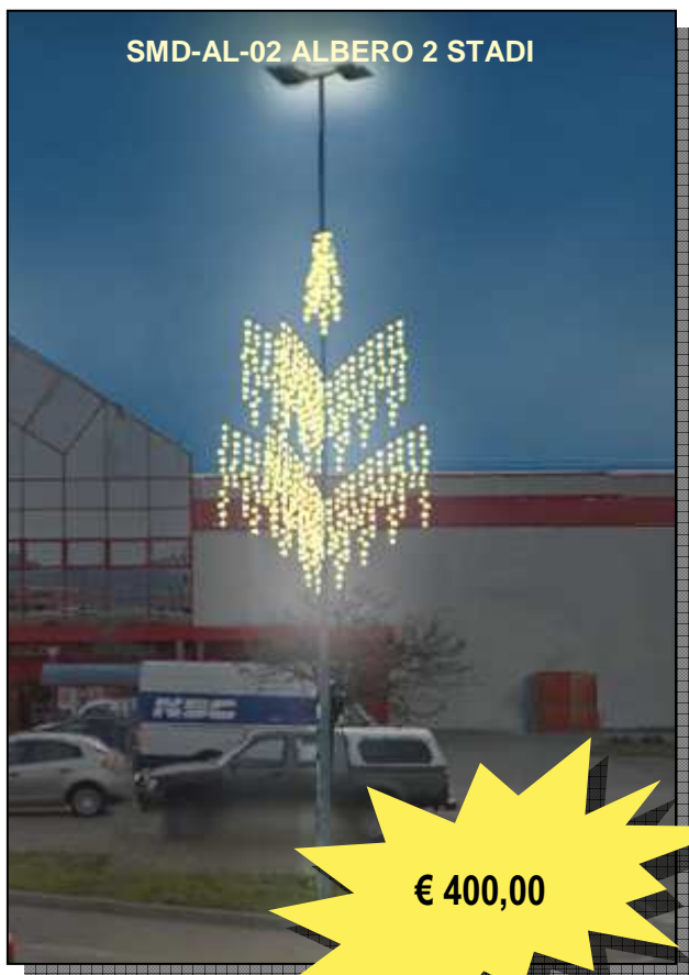
SMD-AL-02 ALBERO 2 STADI