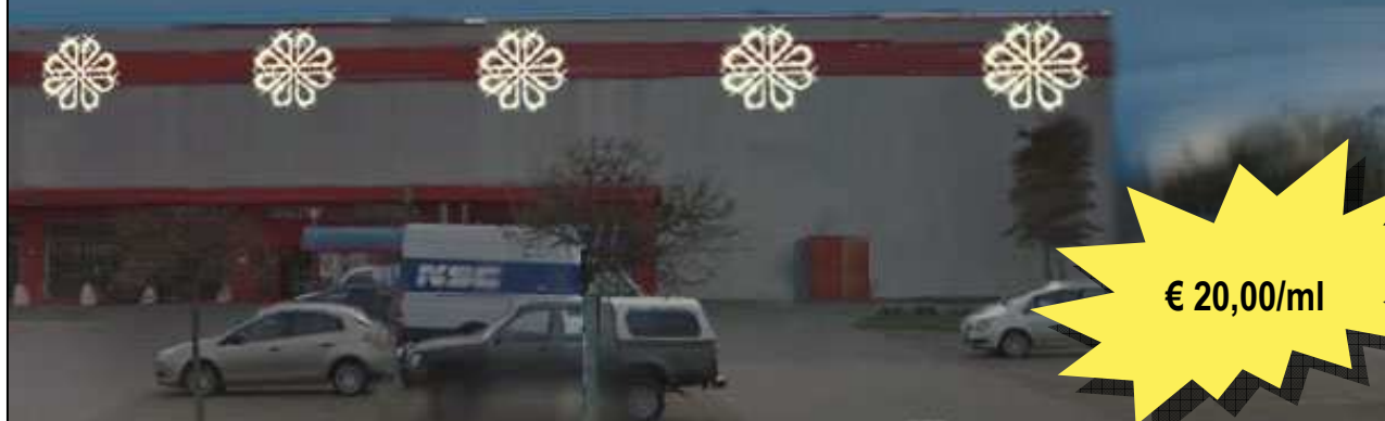
CC10 - FIORE SANREMO