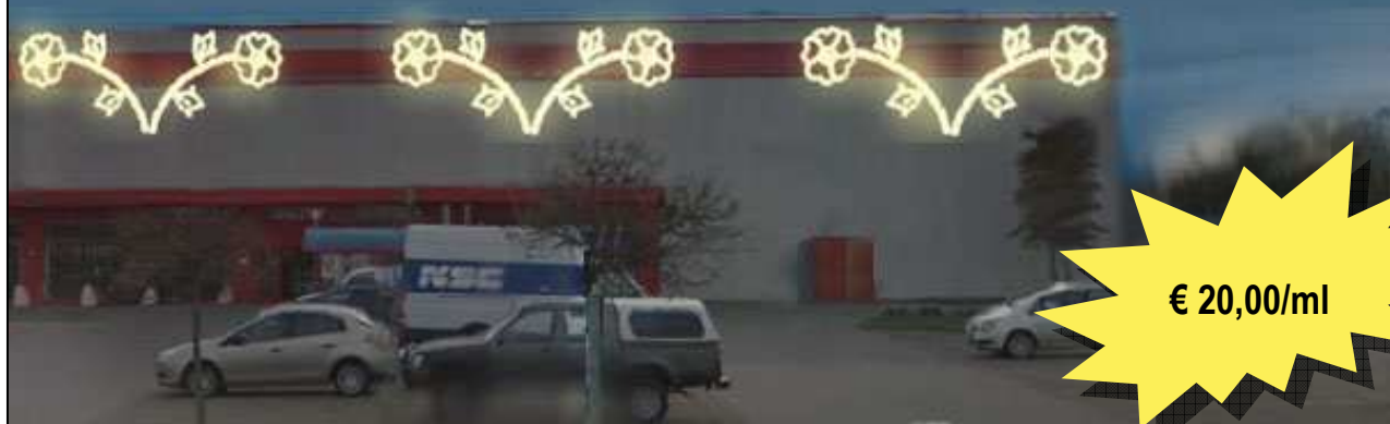
CC11- MEZZA RAGGIERA