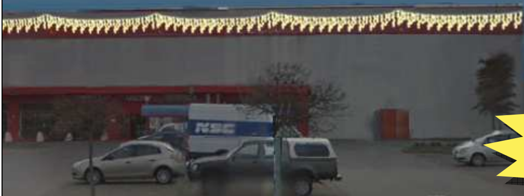
CC12 - FRANGIA H 80 (LED SMD)