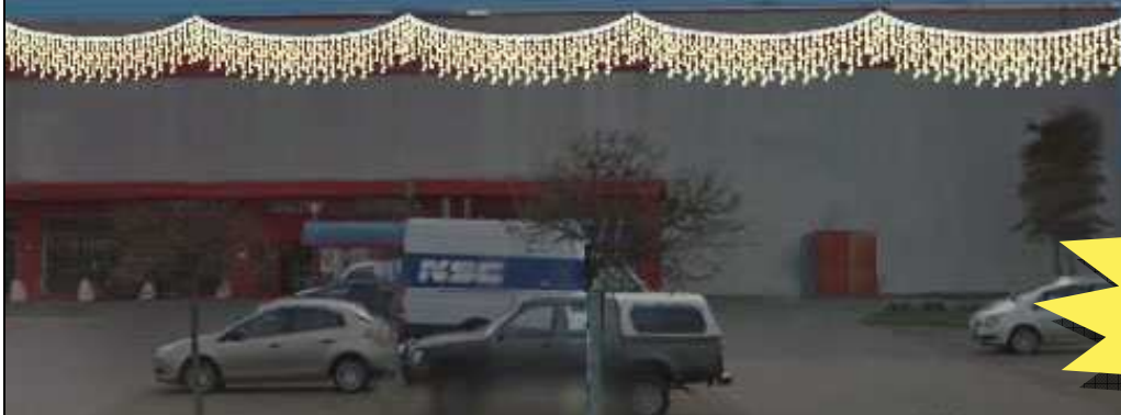
CC13 - NEVE H 150 (LED SMD)