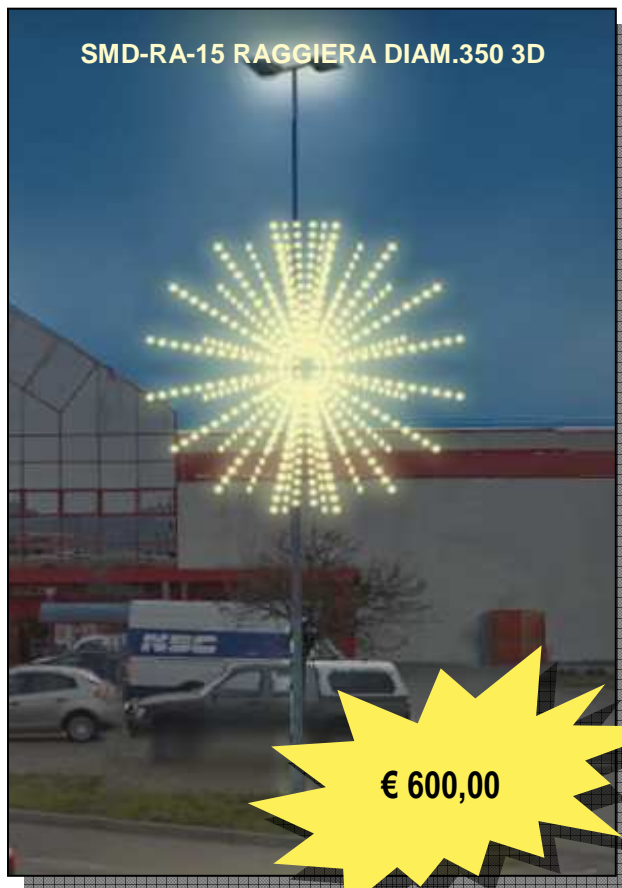
SMD-RA-15 RAGGIERA DIAM.350 3D