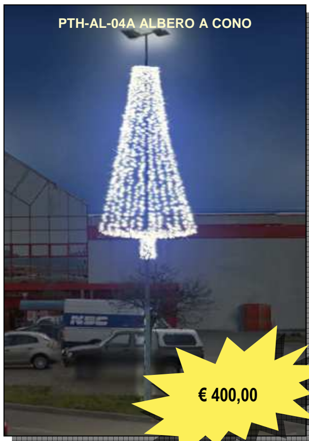
PTH-AL-04A ALBERO A CONO